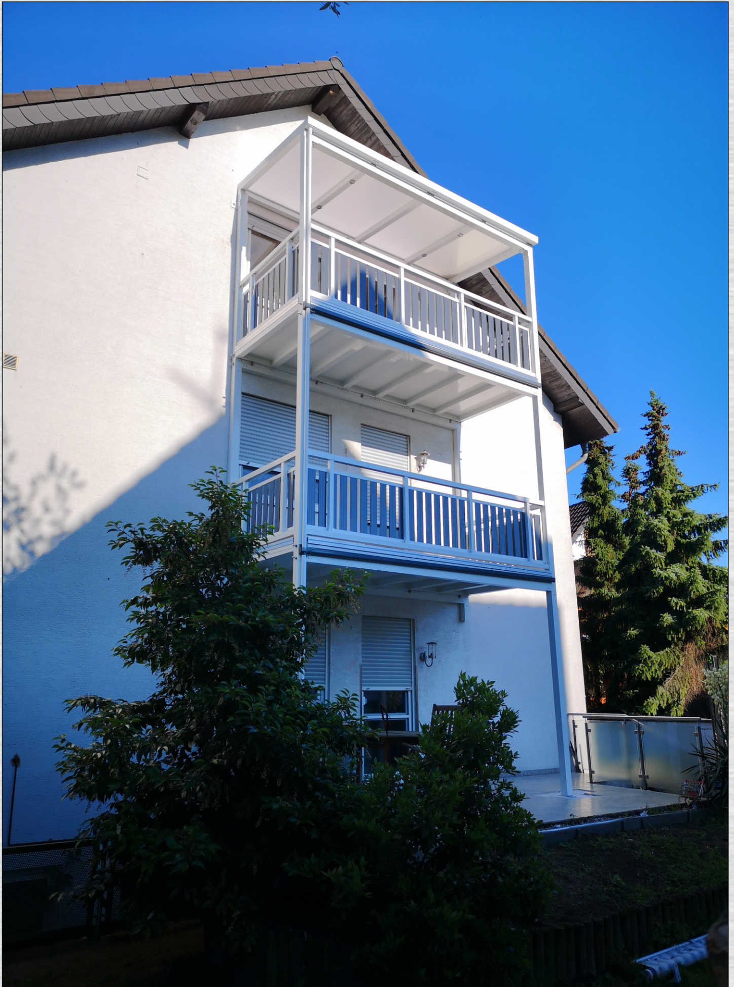
Vorstellbalkon mit Dach und LED Beleuchtung