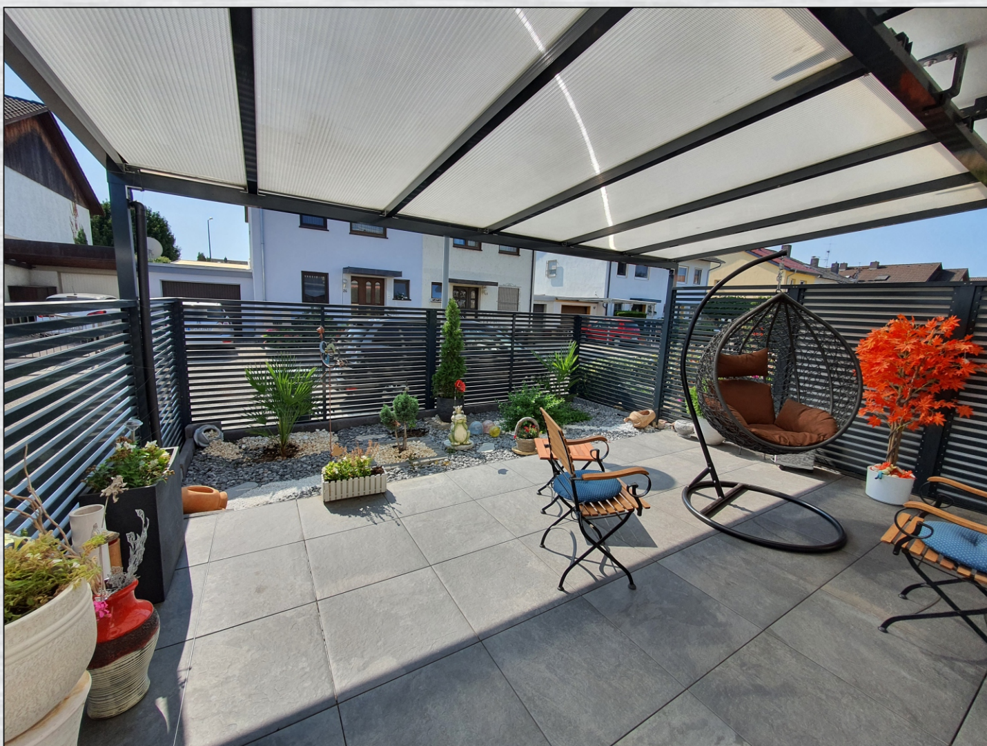
Terrassensanierung, Zaun und Überdachung

Wir suchen bundesweit Architekten und Ingenieure für unser Vertriebsnetzwerk