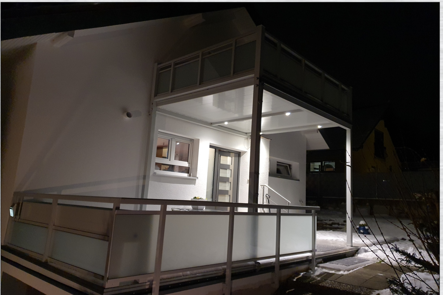
Haustür und Terrasse beleuchtet mit LED