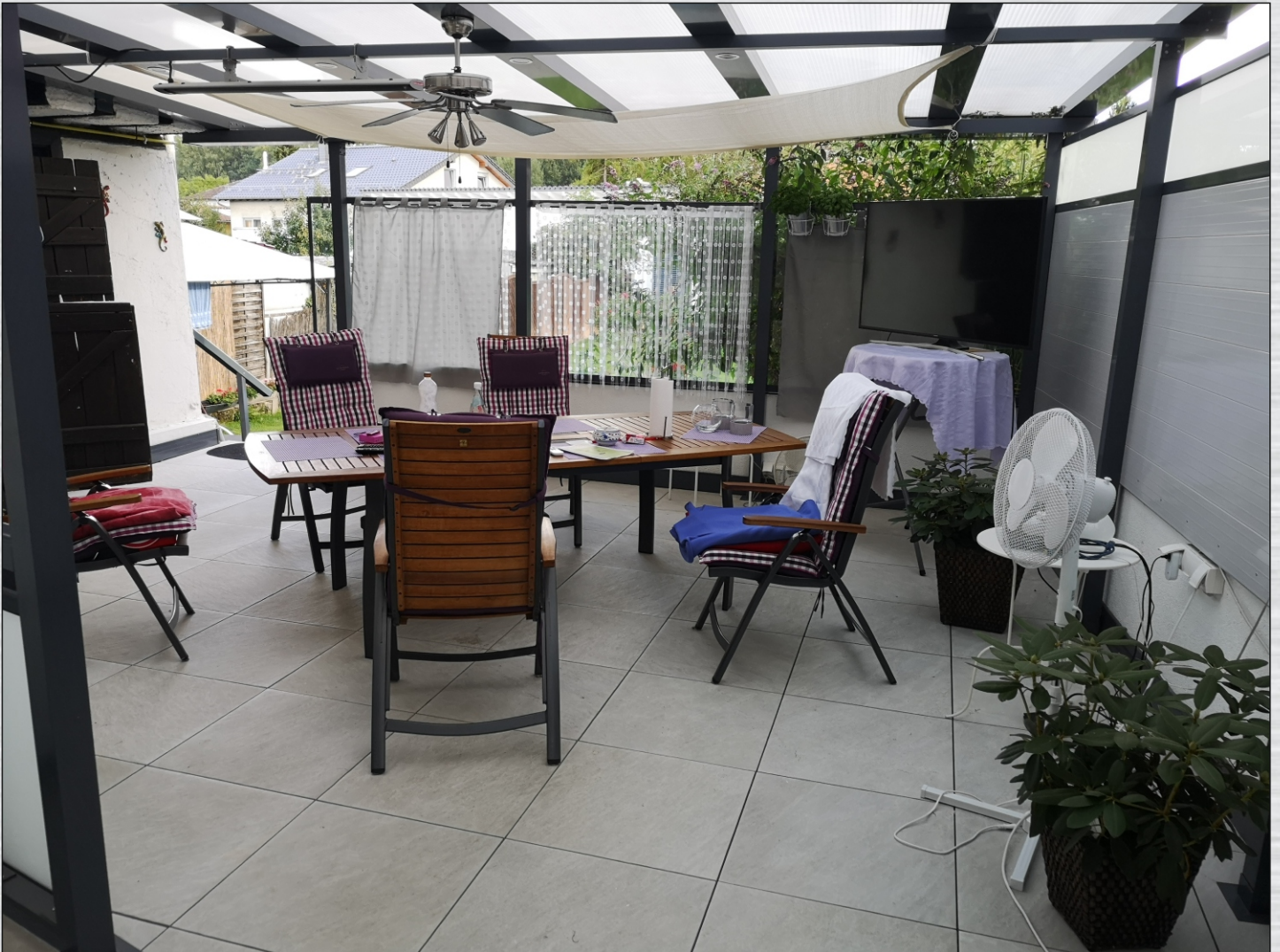
Mit LED Beleuchtung, Windschutz aus Glas zum Garten, Tür und Dach mit Sonnenschutzplatten