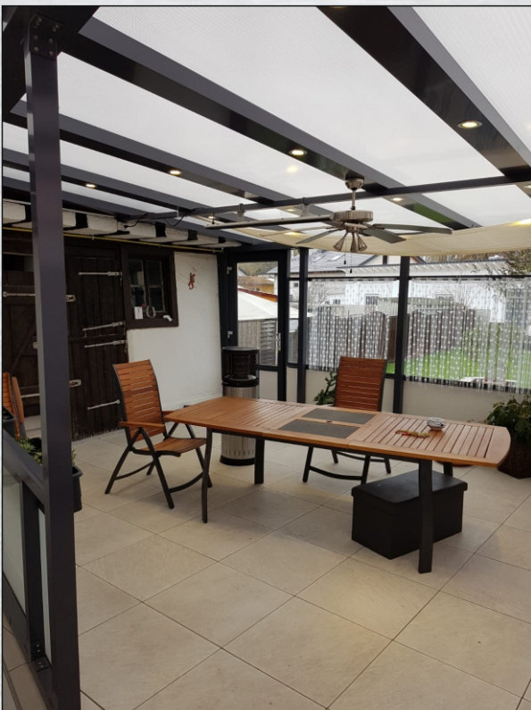
Incl. Bodensanierung mit Feinsteinzeug