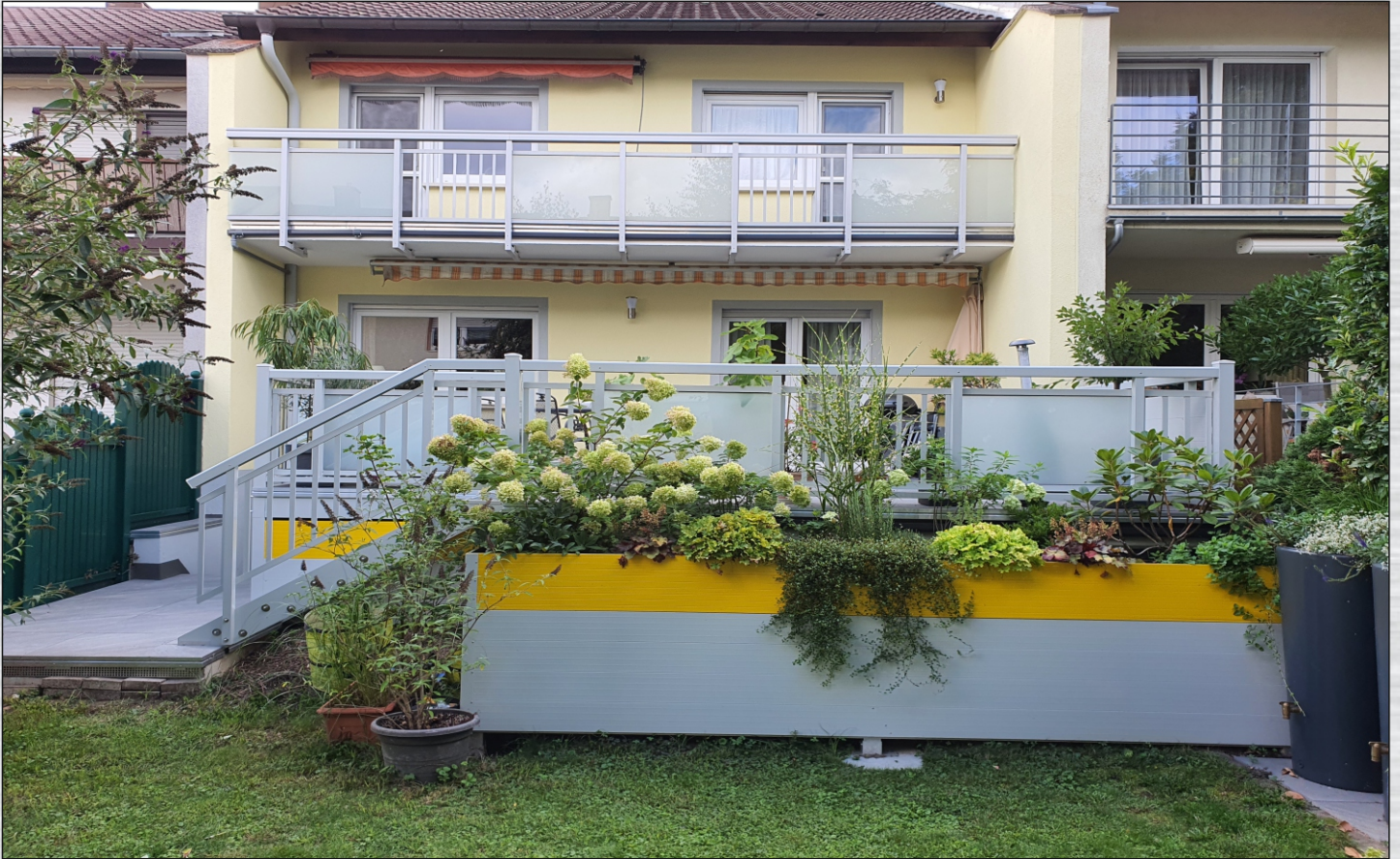
Hochbeet vor der Terrasse