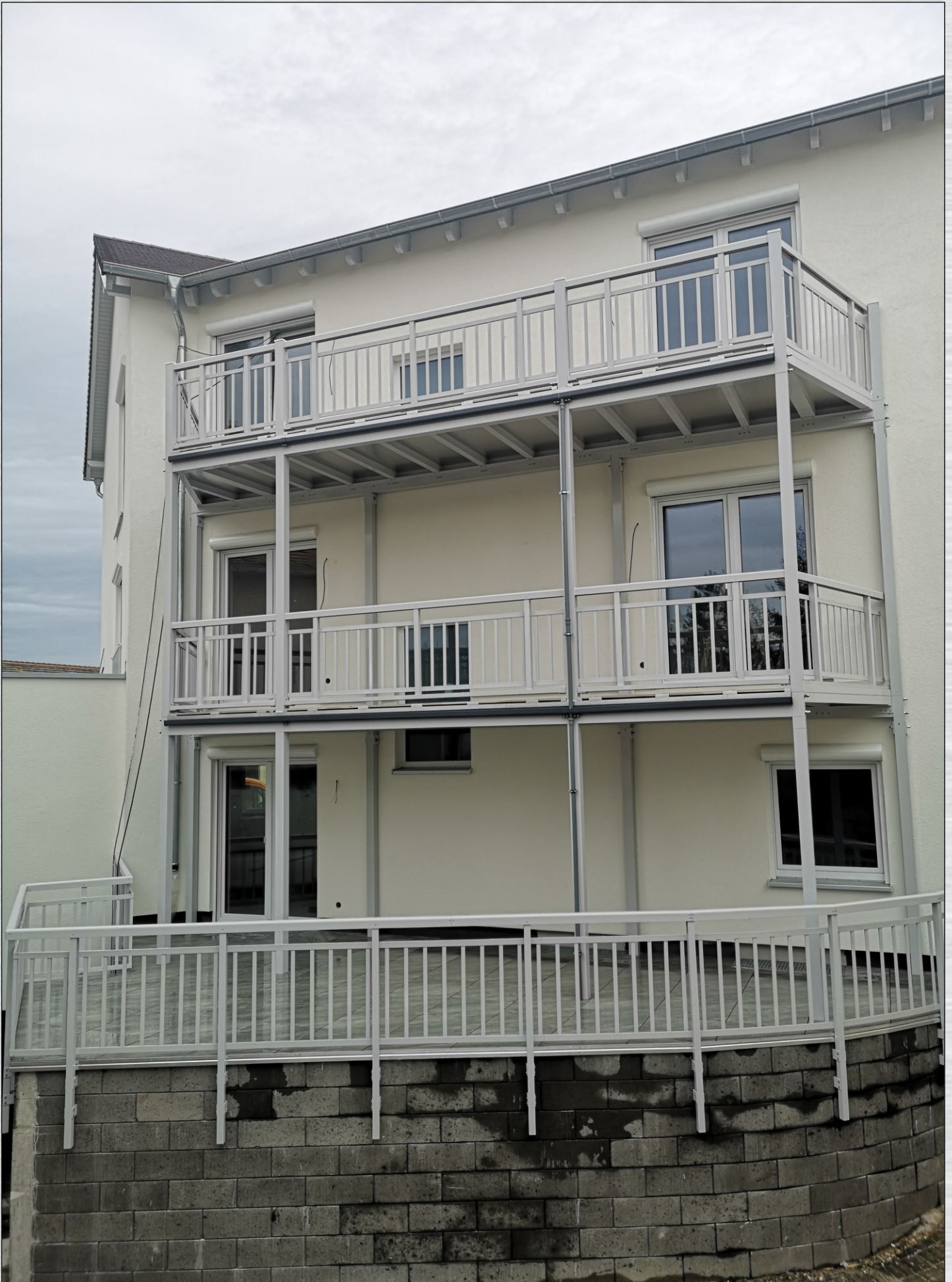
Geländer mit Stabfüllung