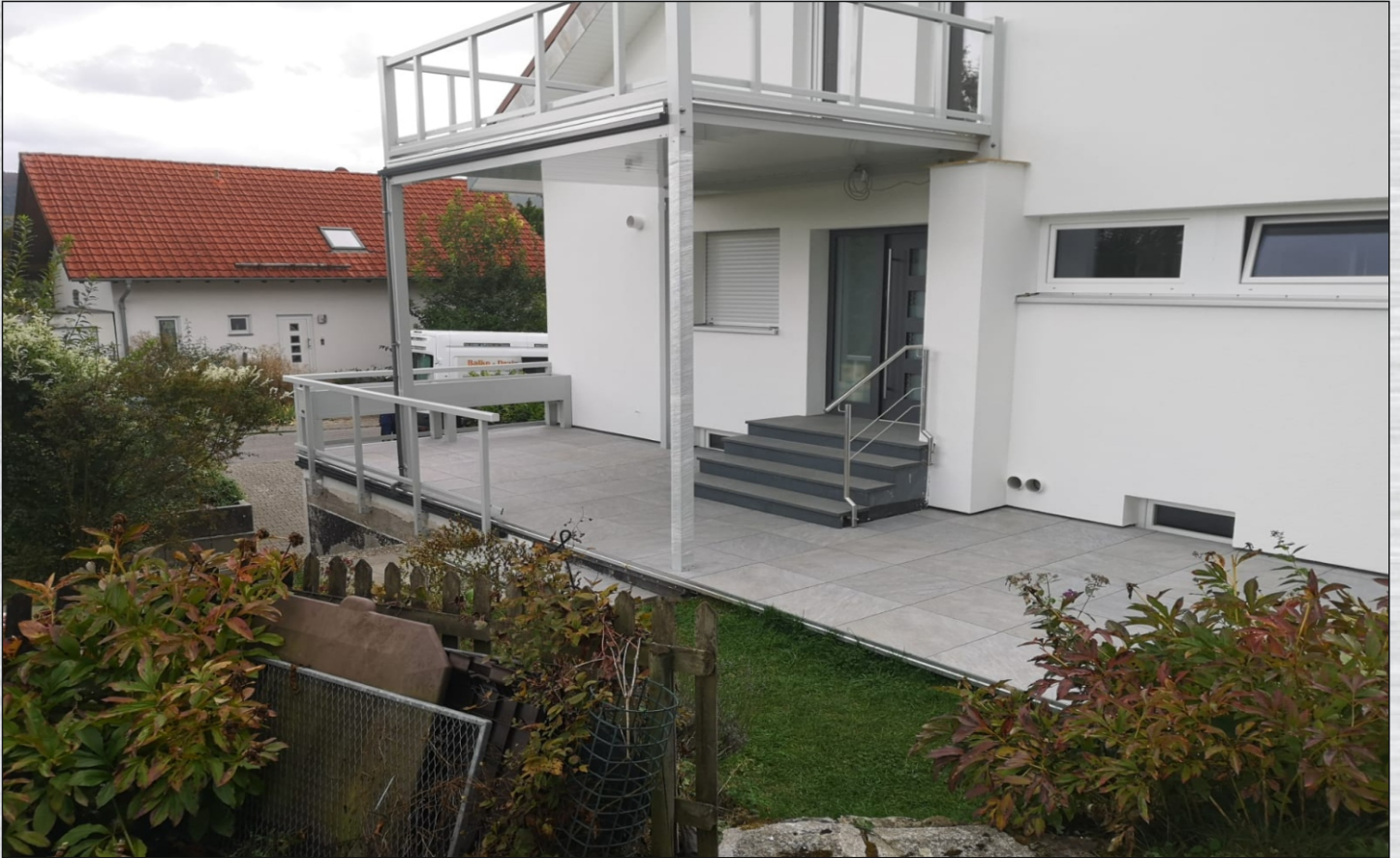
Terrasse wurde mit Feinsteinzeug belegt