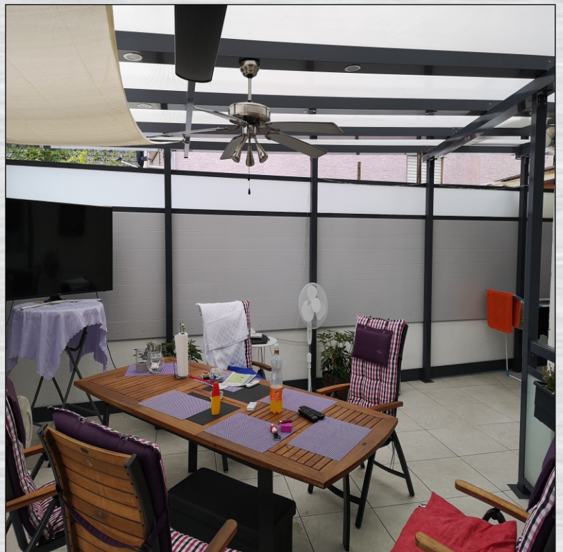
Incl. Sichtschutz zum Nachbarn