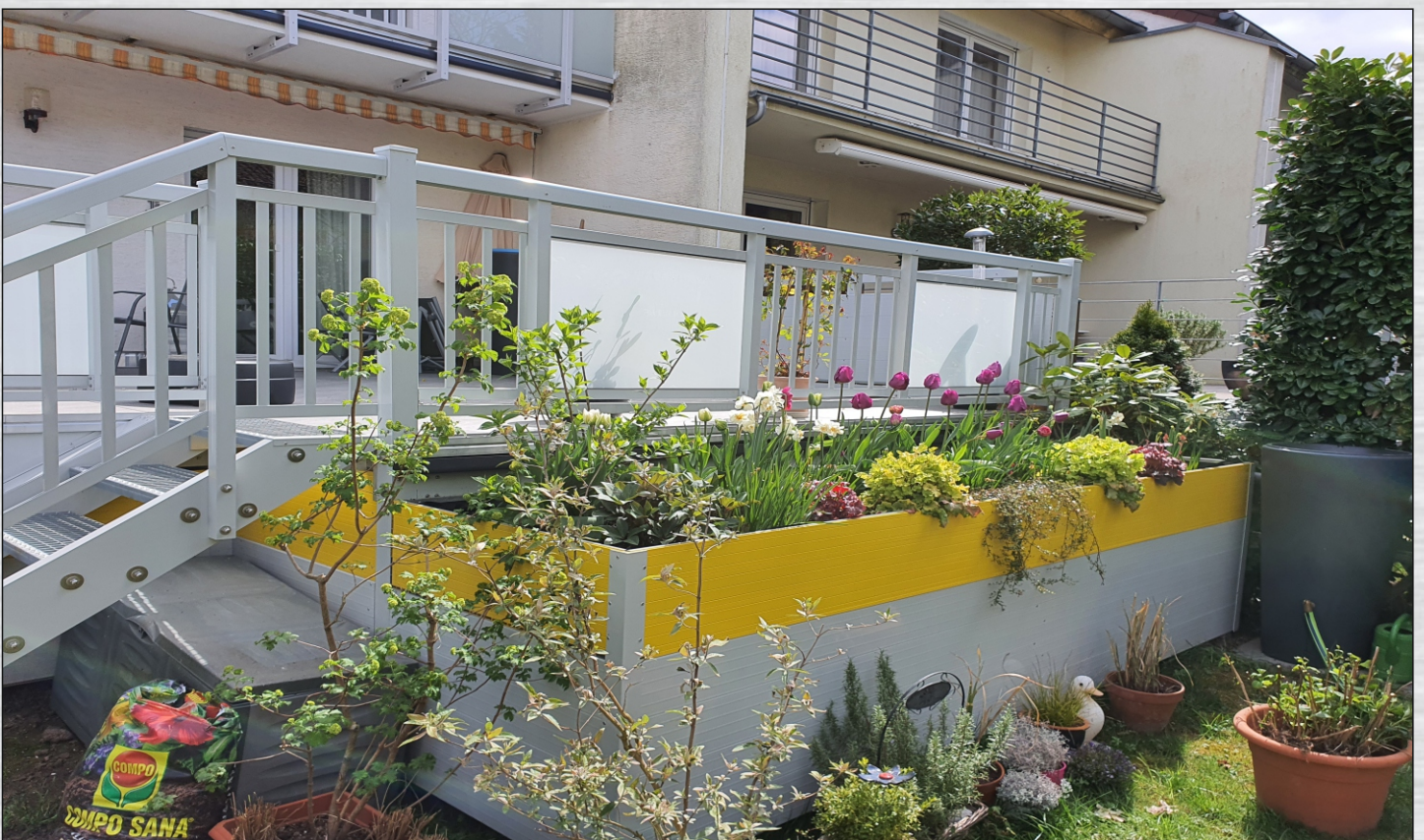
Hochbeet aus Aluminium