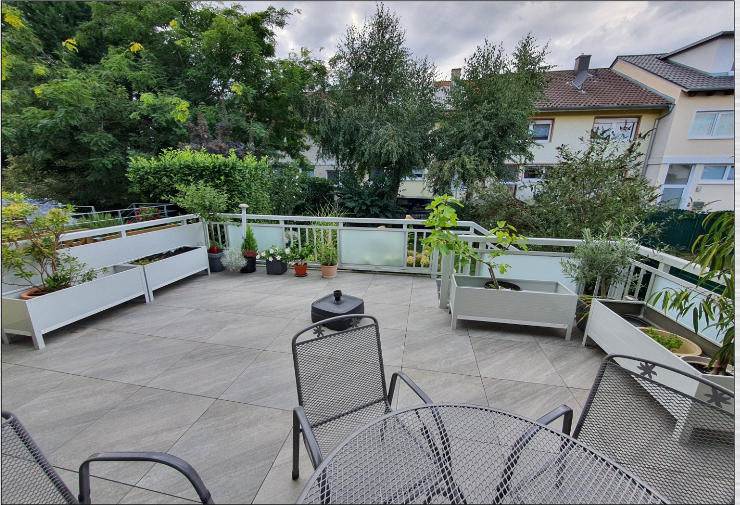
Der Boden mit Feinsteinzeug